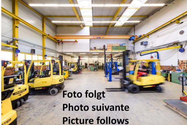
Foto folgt Photo suivante Picture follows