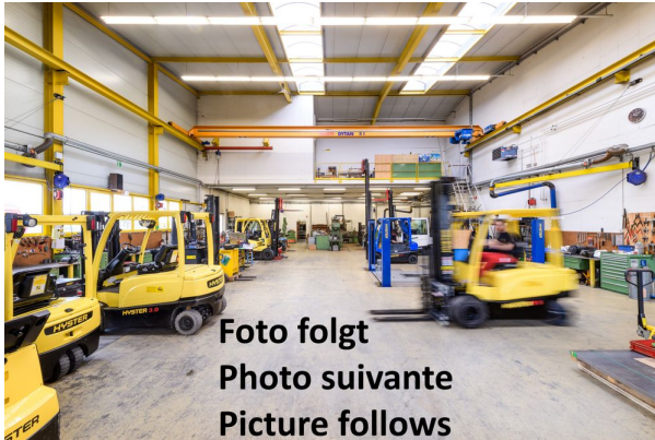
Foto folgt Photo suivante Picture follows